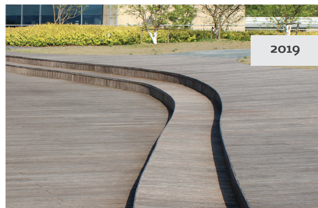
FSC® Bambus TerrassePlank Pro™ Espresso